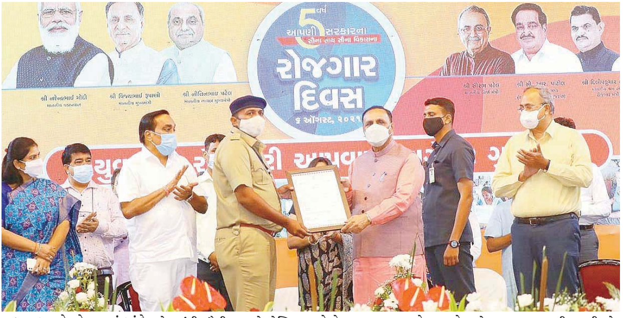
પાટવ્યા હતા. તેમણે જણાવ્યું હતું કે આજે અમારું લક્ષ્યાંક ૫૦ હજાર યુવકોને નોકરી મળે પરંતુ ૬૦ હજાર યુવકોને નોકરી મળી છે. અમે ખાલી લુખ્યા વચન આપતા નથી.

વિશ્વ કોરોનામાં થંભી ગયું જેને લીધે લાખો લોકો બેરોજગાર બન્યા છે, ત્યારે ગુજરાતમાં નવું આશાનું કિરણ જાગ્યું છે